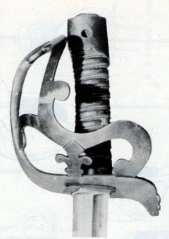
Sabre de 1784 à monture à fleurons, en cuivre laiton. La lame très forte, est à dos et double pancreux. Notez la monture dont la calotte est percèe afin de permettre l'attache de la dragonne. La pièce de pouce, invisible ici, est de cuir.

En 1790, ces chasseurs à cheval dont l'armement se confondait avec celui des dragons dont ils sont issus, reçoivent une arme qui est une sorte de compromis entre leur ancien sabre de dragons et celui de la cavalerie légère dont ils sont appelés à assurer le service. Sur une lame à flèche, plus longue que celle des hussards et à pan creux, est montée une garde en demi-